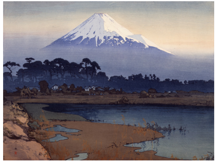
「富士拾景 朝日」1926(大正15)年