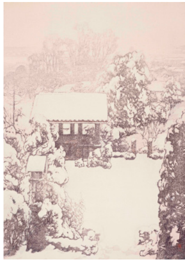
「東京拾二題 中里之雪」1928(昭和3)年 個人蔵