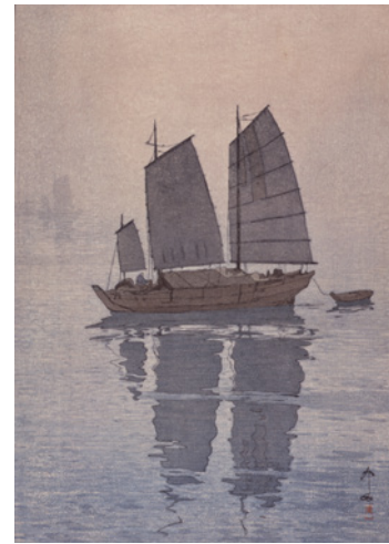
「瀬戸内海集 帆船 霧」1926(大正15)年