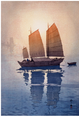
「瀬戸内海集 帆船 朝」1926(大正15)年