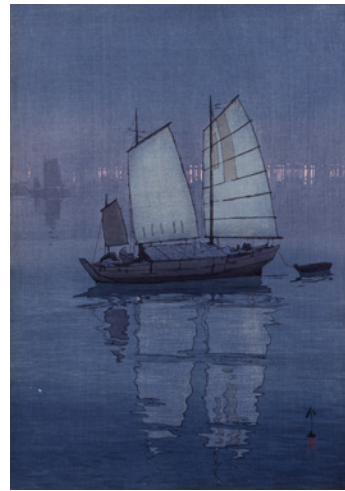
「瀬戸内海集 帆船 夜」1926(大正15)年