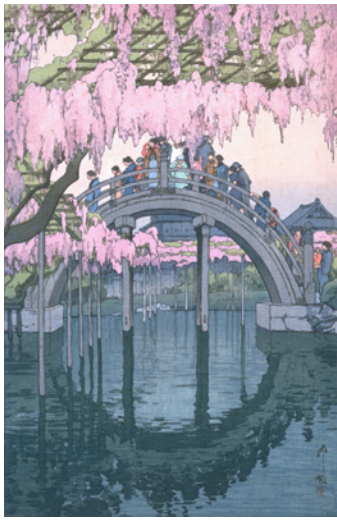
「東京拾二題 亀井戸」1927(昭和2)年