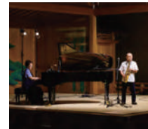
坂田明 ジャズコンサート