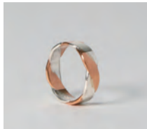
銀銅コンビリング 奥山峰石(人間国宝)