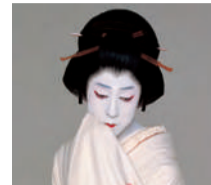
地唄「雪」 坂東玉三郎(人間国宝)

檜皮葺き・入母屋造りの屋根に、総檜造りの能舞台です。優れた伝統芸能の紹介をはじめ、クラシック、ポップスのコンサート、講演会など多目的に活用しています。