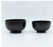
漆碗 ちょもらんま 室瀬和美(人間国宝) + 目白漆學會

美術館のオリジナルグッズをはじめ伝統工芸作家による工芸品を販売しています。人間国宝の作品を購入しやすいリーズナブルな価格で取り揃え、美のある暮らしを提案します。