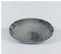
色絵薄墨皿はじき秋草文皿 十四代今泉今右衛門(人間国宝)