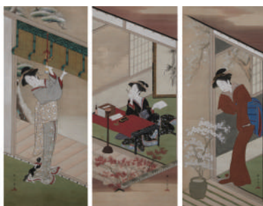
重文「雪月花園」 勝川春章 江戸時代18世紀