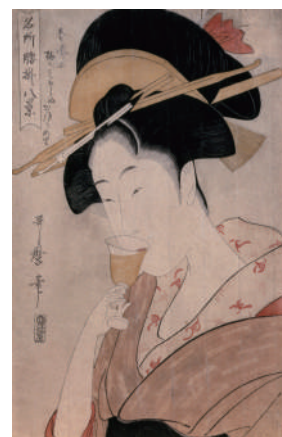
「名所腰掛八景」 喜多川歌麿 江戸時代18世紀