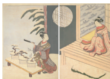
「見立鉢の木」 鈴木春信 江戸時代 明和3年(1766)頃