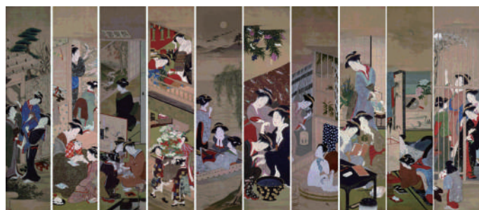
重文「婦女風俗十二ヶ月図」 勝川春章 江戸時代 18世紀