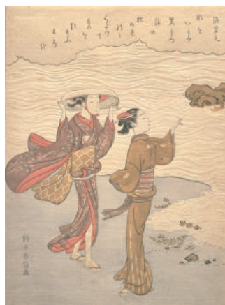
「源重之（三十六歌仙のうち）」 鈴木春信 江戸時代 明和4～5(1767-8)年頃