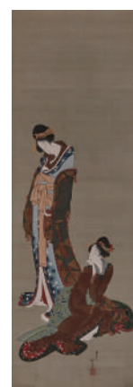
重文「二美人図」 葛飾北斎 江戸時代19世紀