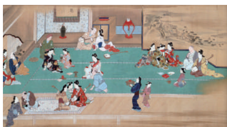
江戸風俗図巻 菱川師宣 江戸時代17世紀