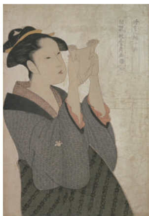
「婦女人相十品 文読美人」 喜多川歌麿 江戸時代18世紀